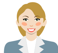
SALARIÉS EN MUTATION